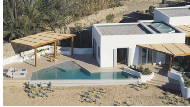
Üstte, altta ve en altta: Mykonos'ta iki ayrı lokasyonda oteli bulunan Bill & Coo'nun Ege manzaralı villalarından biri Solda: Bill & Coo Coast ana havuzu