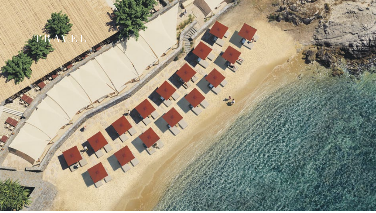
Sahilde hizmet veren Beefbar'ın Atina'da da şubesi var