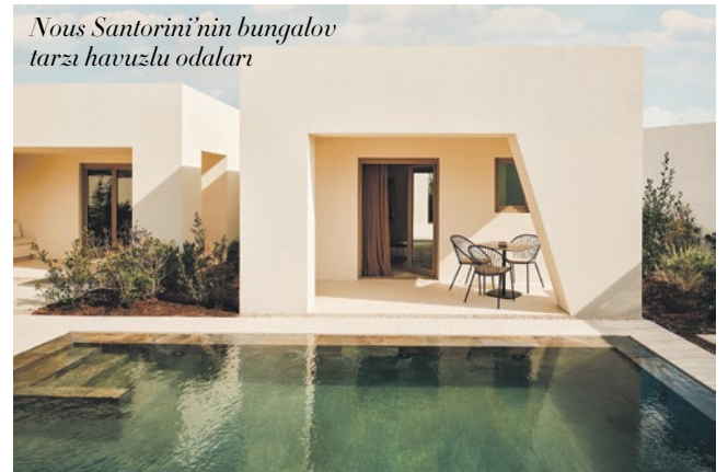
Nous Santorini'nin bungalow tarzı havuzlu odaları